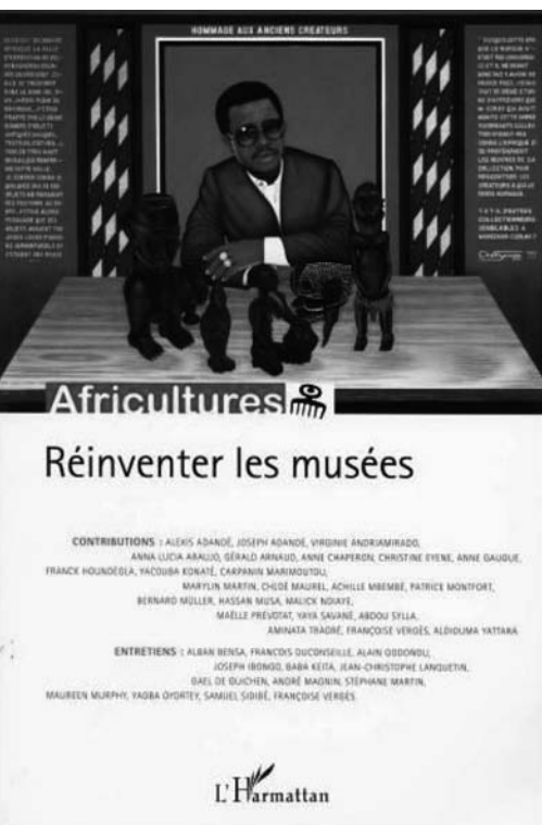
Copertina di un numero della rivista Africultures

Nell'epoca post-11 settembre, che ha visto l'utilizzo delle identità in senso assolutistico e rivendicativo, i programmi della cooperazione culturale internazionale sono sempre “orientati in senso positivo, della cultura come significato da dare alle cose, come sorgente dei criteri di valutazione e di giudizio, come educazione/identità/armonia di rapporti sociali, come nesso tra eredità culturale, industria culturale e